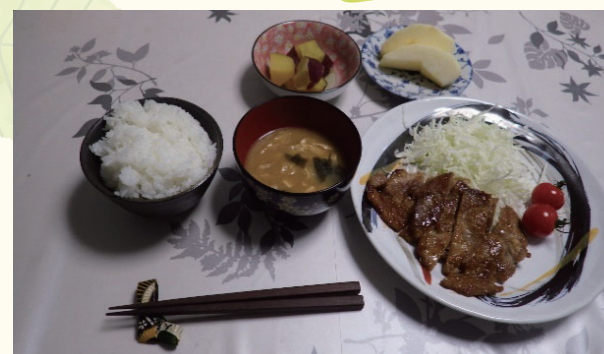
豚肩ロース生姜焼き・さつまいも煮物