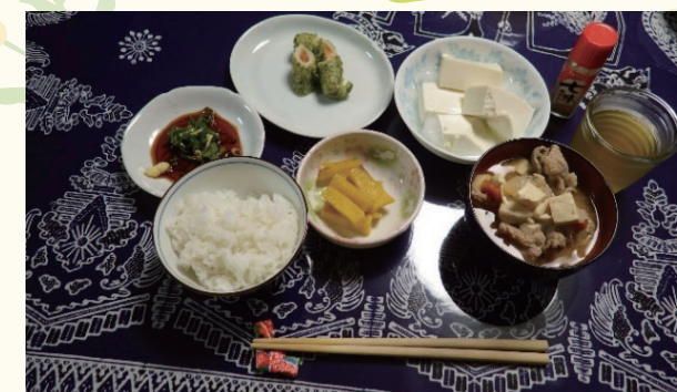
豚汁・冷やっこ・ちくわの揚げ物・卵