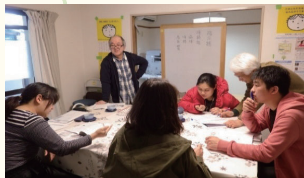
貧困児童・外国由来児童への学習支援