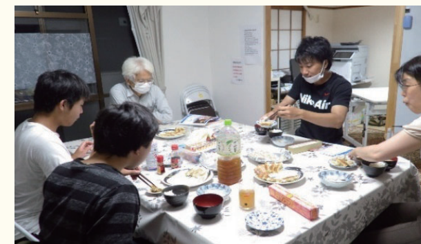
社会的養護等児童の食事風景